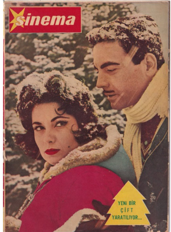
Görsel 1. Sinema Dergisi (1962)

Türk sinemasında yıldız kavramının ortaya çıkışı ise 1950’ler sonrasına tekabül etmektedir. Öncesindeki dönemde sinemada tiyatro oyuncularının hâkimiyeti söz konusudur ve bunların arasında Cahide Sonku dışında yıldız olarak tanımlanabilecek oyuncu yer almamaktadır. Türk sinemasında yıldızlar yönetmenlerin öngörülleri ile şekillenen tercihleri veya sinema dergilerinin açtığı yarışmalar vasıtasıyla yaratılmıştır (Özgüç’ten aktaran Öz, 2022). Bu yıldızlardan ilk ikisi, 1938 yılında on beş günlük olarak yayımlanmaya başlayan, 1950’den itibaren haftalık olarak yayınına devam eden Yıldız adlı derginin (Evren, 1993) yarışmasında birinci olan Belgin Doruk ve Ayhan Işık’tır.