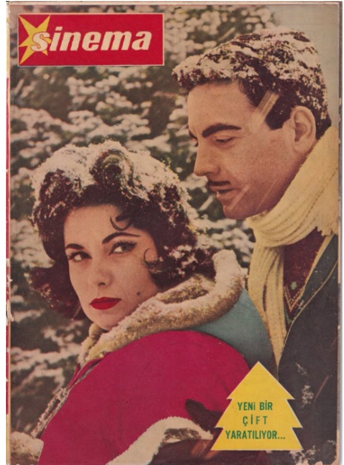
Görsel 1. Sinema Dergisi (1962)