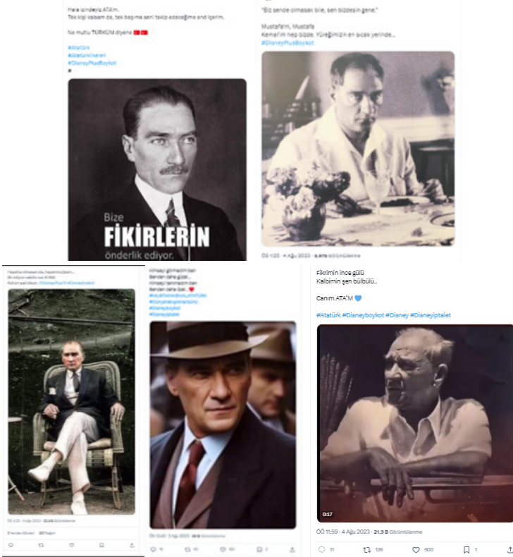
Resim 1. "Toplumsal Duygudaşlık" temasına yönelik tweet örnekleri

Bu tema, X'te karşımıza çıkan en baskın temalardan biridir ve genel olarak platformda ifade bulan boykot çağrılarının bir parçası olmakla birlikte, doğrudan boykota davet yerine Atatürk imgesini yeniden benimseme, koruma ve hatırlatma çerçevesinde şekillenmektedir. Yine sayısı çok fazla olmayan fakat Atatürk'ün doğrudan sözlerini içeren tweetler bu tema altında toplanmıştır. 3 Bu başlık altında incelenen tweetler Atatürk imgesini kolektif hafızada yeniden inşa etmekte ve hatırlatma ediminin öznesi olan bu imgeyle kurulan farklı bir duygusal ilişkilendirme biçimine işaret etmektedir. Bu duygusal ilişkilendirme Atatürk'le kurulan bir gönül bağı ve Atatürk imgesi çerçevesinde ortaya çıkan duygudaşlıktır. Söz konusu tweetlerdeki duygu tonu çoğu zaman sevgi, koruma ve özlemle karışık yer yer hüzdür. Bu noktayı örnekleyen tweetlerin görselleri ve çözümlenmeleri aşağıdaki gibidir: