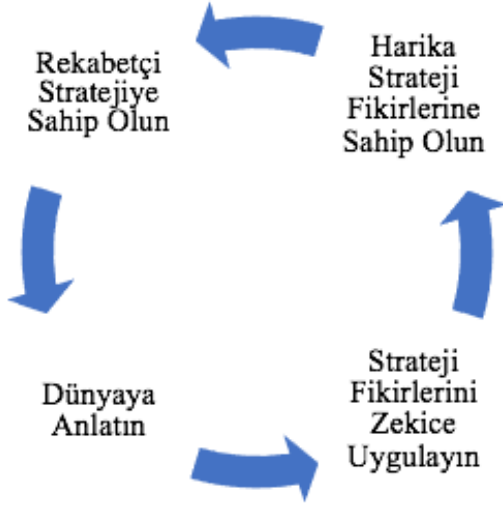
Şekil 2. Rekabetçi Kimliğin Verimli Döngüsü