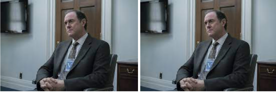
Tablo 7: Tom Hammerschmitt'in Genel Yayın Yönetmenliği ve Beyaz Saray'da medyanın denetleme ve dengeleme temsili sahnelerinde gösterilen

Fotoğraf 7: Geleneksel Medya Temsilinde Tom Hammerschmitt ve Beyaz Saray'da Frank Underwood Makamında Diyalog Sahnesi