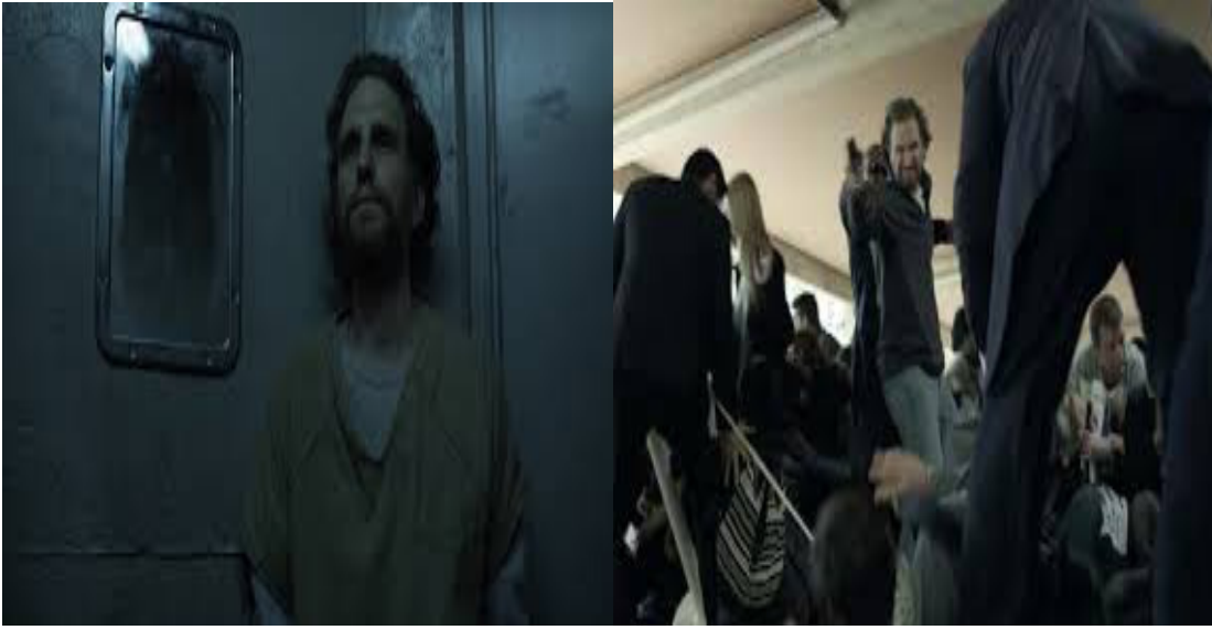
Tablo 6: Lucas Goodwin'in cezaevi ve suikast sahnelerinde göstergelenen